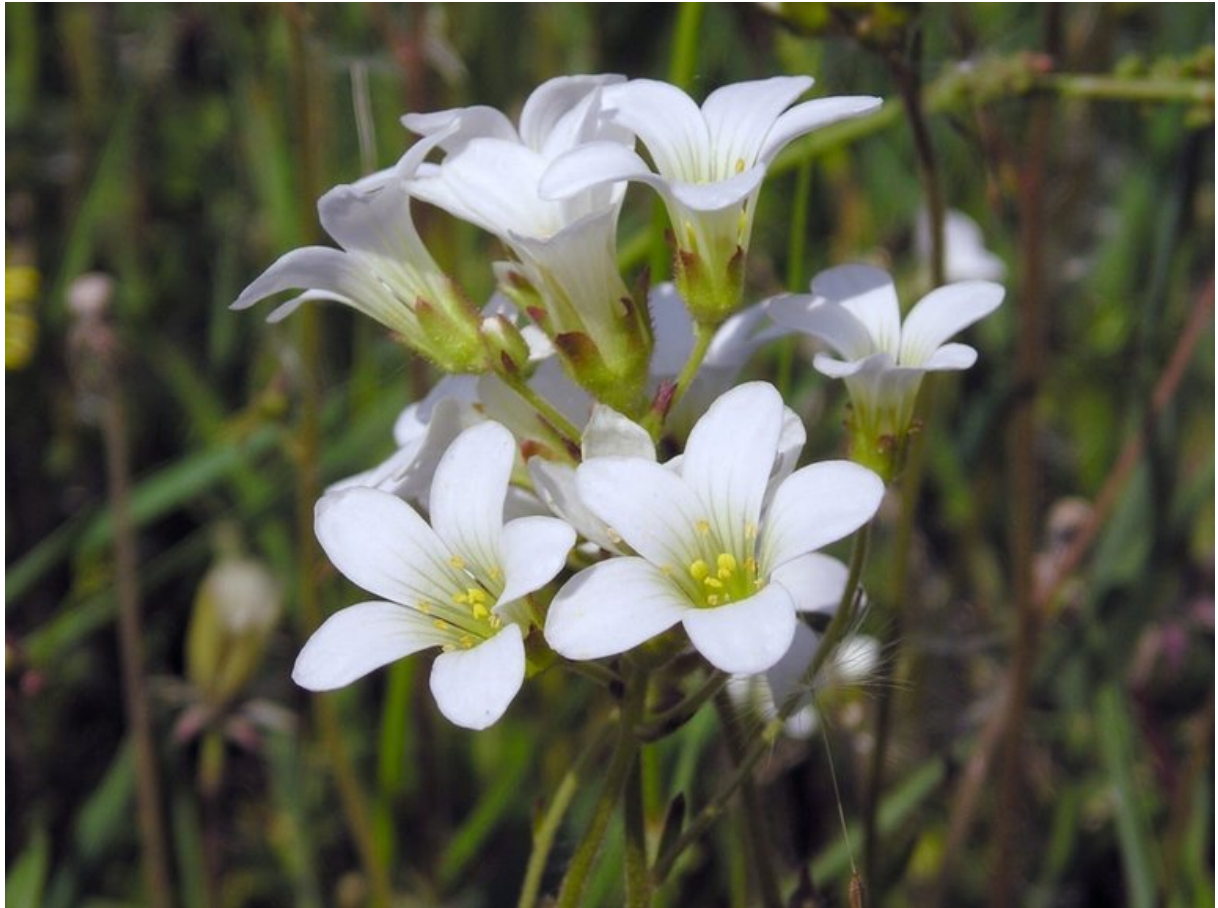
Knolsteenbreek, een kritische soort die hoge eisen stelt aan de groeiplaats